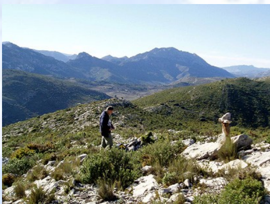
Foto 1) Localización de la boca, vista tomada a mitad camino entre la sima y la cumbre del Frare

Sus alrededores son iguales a os de la sima del Frare I, predominando la jara como principal matorral. (Foto 1, 2 y 3)