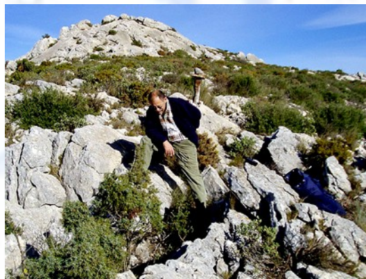
Foto 2) Localización y boca de la cavidad tomada en sentido contrario a la foto 1